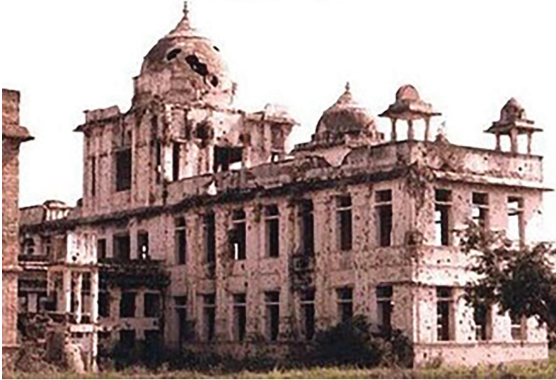
1981 மே 31ஆம் நாள் எரியூட்டப்பட்ட யாழ்ப்பாணப் பொது நூலகம்

ஈழத்தமிழர் வரலாற்றில் மேலும் ஒரு கறைபடிந்த நாளாக 1981 மே 31ஆம் நாள் அமைந்தது. இந்நாளில் சிங்கள அரசினால் யாழ்ப்பாணப் பொது நூலகம் எரியூட்டப்பட்டது. பல்லாயிரம் நூல்களும் பழைய ஏட்டுச்சுவடிகளும் செய்தித்தாள் தொகுதிகளும் எரிந்து சாம்பலாகின. இந்நிகழ்வு 20ஆம் நூற்றாண்டின் கலாசார இன அழிப்புகளுள் ஒரு மிகப்பெரும் அழிப்பாகக் கருதப்படுகிறது. இவ்வழிப்பு நடந்த காலகட்டத்தில் யாழ்ப்பாணப் பொதுநூலகம் கிட்டத்தட்ட 97,000 அரிய நூல்களுடன் தென்கிழக்காசியாவிலேயே மிகப்பெரிய நூலகமாகத் திகழ்ந்தது.